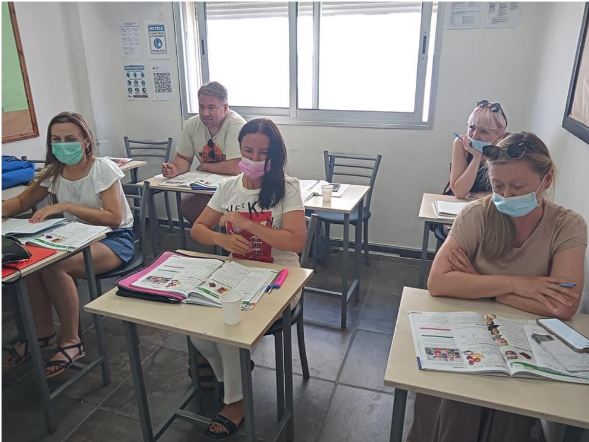
Zdjęcie przedstawia 1. tydzień kursu na poziomie A1.