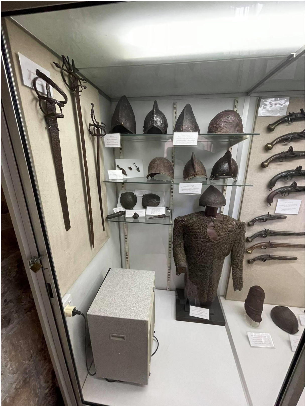
Eksponaty powiązane z historyczną militarystką Cypru. Artefakty i broń znajdują się w Zamku w Limassol, które obecnie pełni funkcję Muzeum Broni Średniowiecznej.