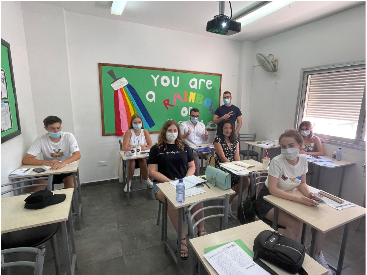
Zdjęcie przedstawia drugi tydzień kursu, kiedy dołączyli już do nas Szwajcarzy oraz Niemcy.