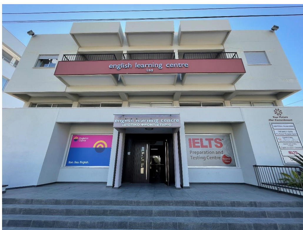
Szkoła English in Cyprus .

W ramach projektu „Mobilność kadry edukacji szkolnej” finansowanego ze środków Europejskiego Funduszu Społecznego w ramach Programu Operacyjnego Wiedza Edukacja Rozwój (PO WER) realizowanego na zasadach programu Erasmus+ nauczyciele Szkoły Podstawowej nr 60 im. Wojciecha Bogusławskiego w Poznaniu 1 brali udział w kursie języka angielskiego: We are Europeans. The mobility of the teaching staff a key to Europe's gates. 2 Niniejszy kurs języka angielskiego odbywał się na Cyprze w międzynarodowej szkole English in Cyprus .