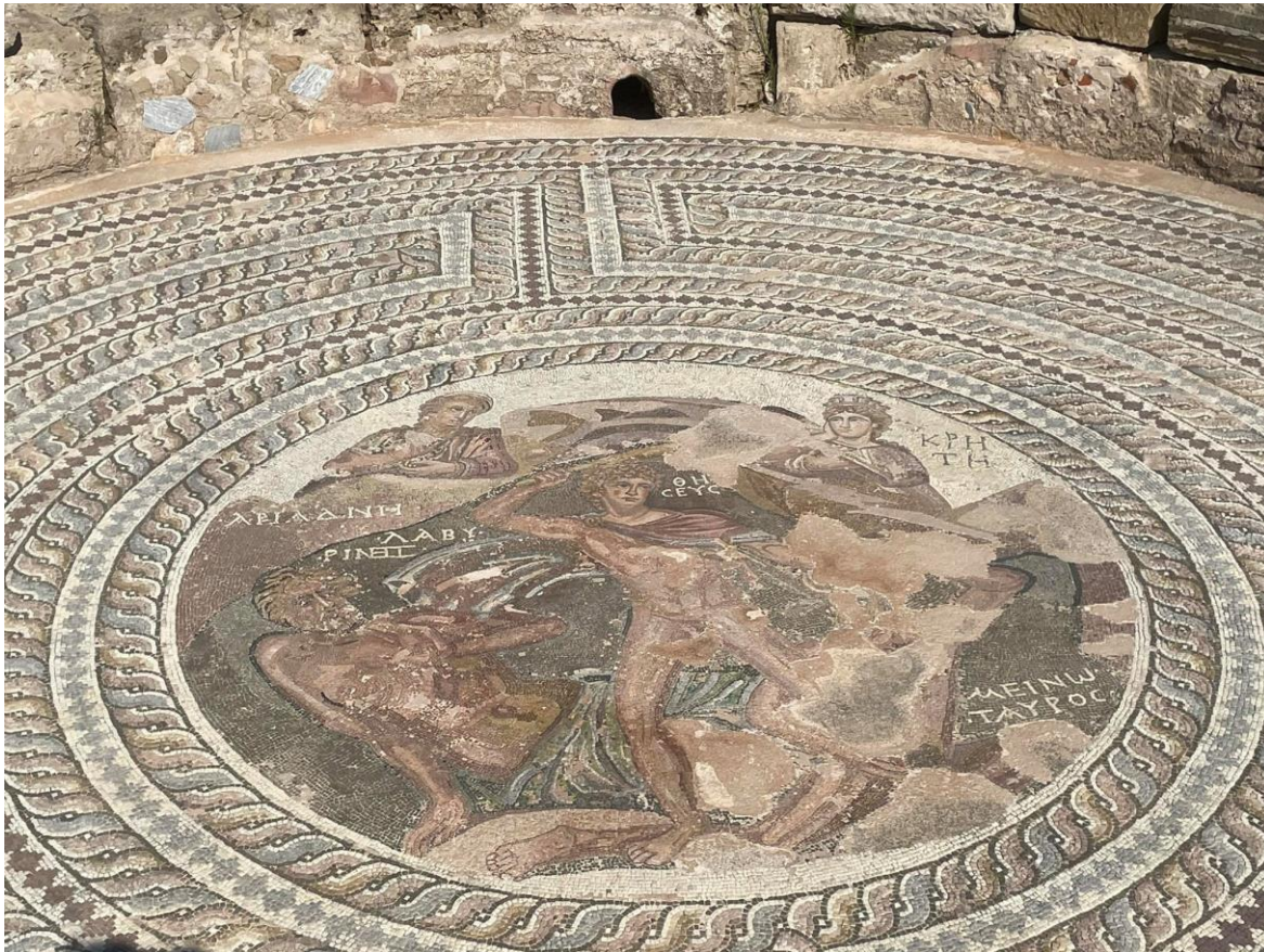
Na zdjęciu widać mozaikę w ramach zdobień domu Tezeusza.