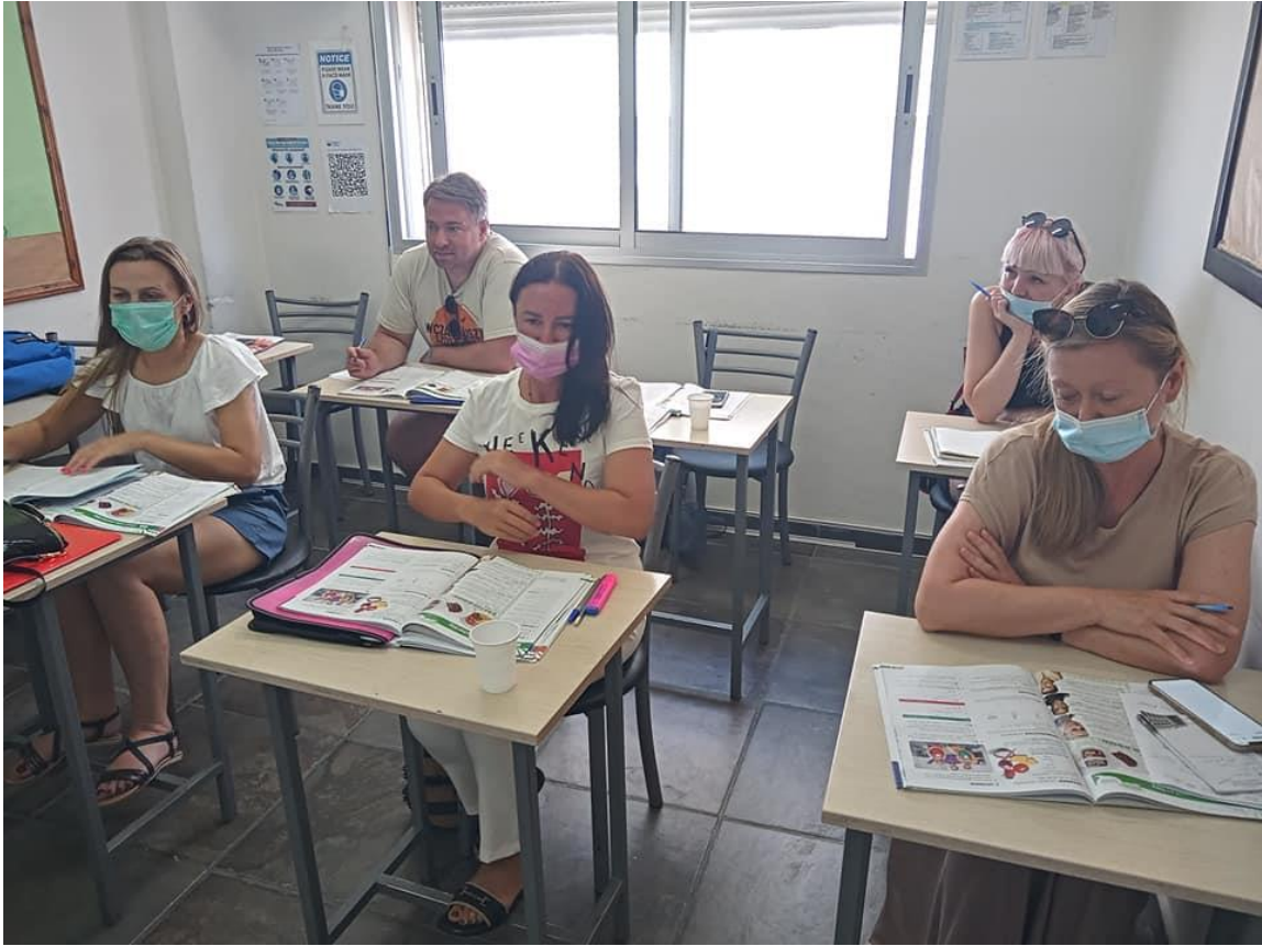
Zdjęcie przedstawia 1. tydzień kursu na poziomie A1.