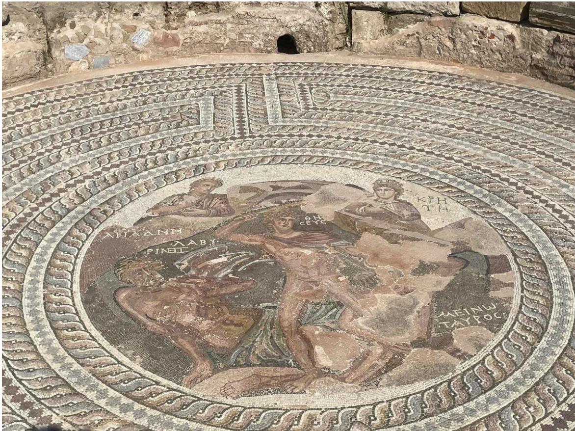
Na zdjęciu widać mozaikę w ramach zdobień domu Tezeusza.