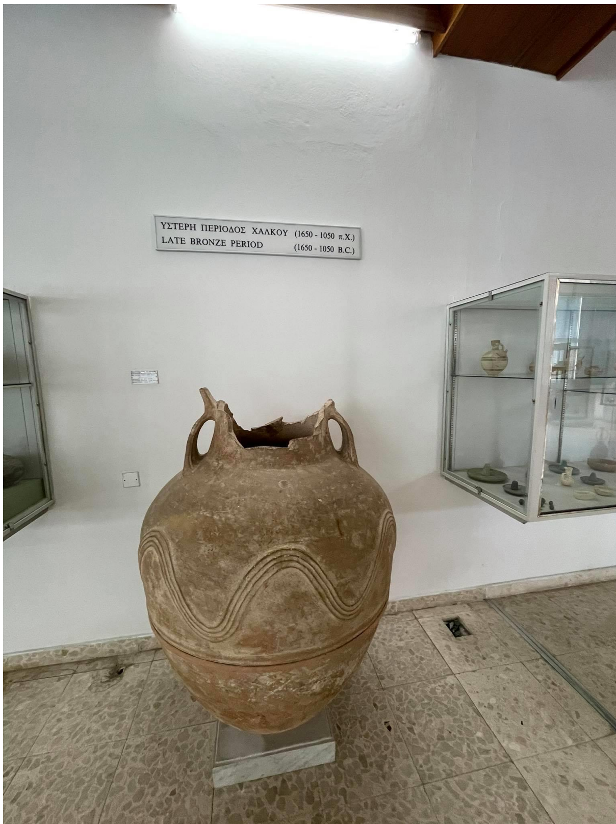
Historyczny artefakt datowany na cezurę czasową widoczną na zdjęciu. Ekspонат dostępny w Muzeum Archeologicznym w centrum miasta Limassol.