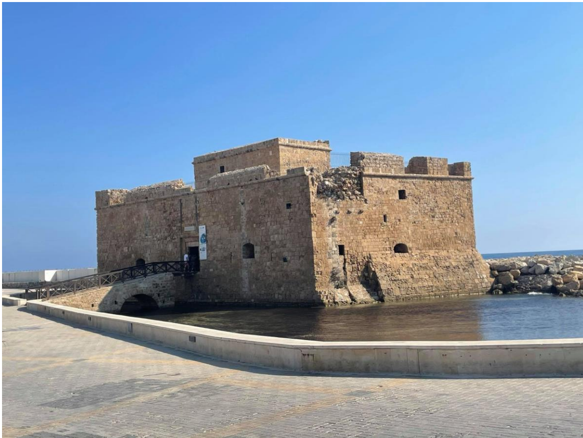
Średniowieczny zamek w Pafos. Współcześnie w jego środku znajduje się centrum kultury.