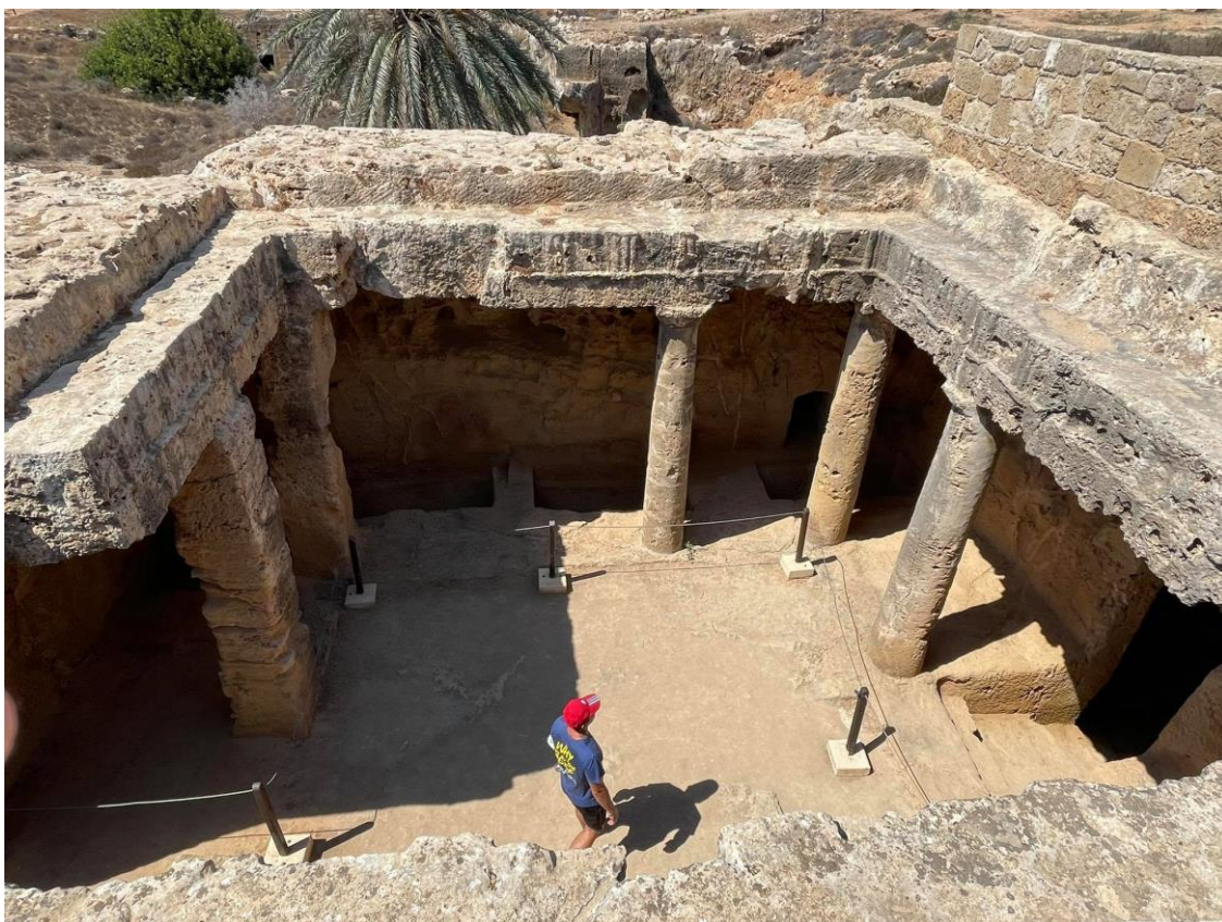
Groby Królewskie w Pafos.