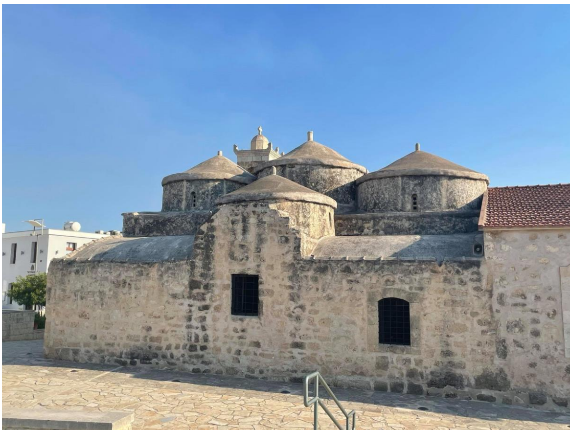
Zdjęcie przedstawia Kościół św. Łazarza. Budynek znajduje się w centrum Larnaki.