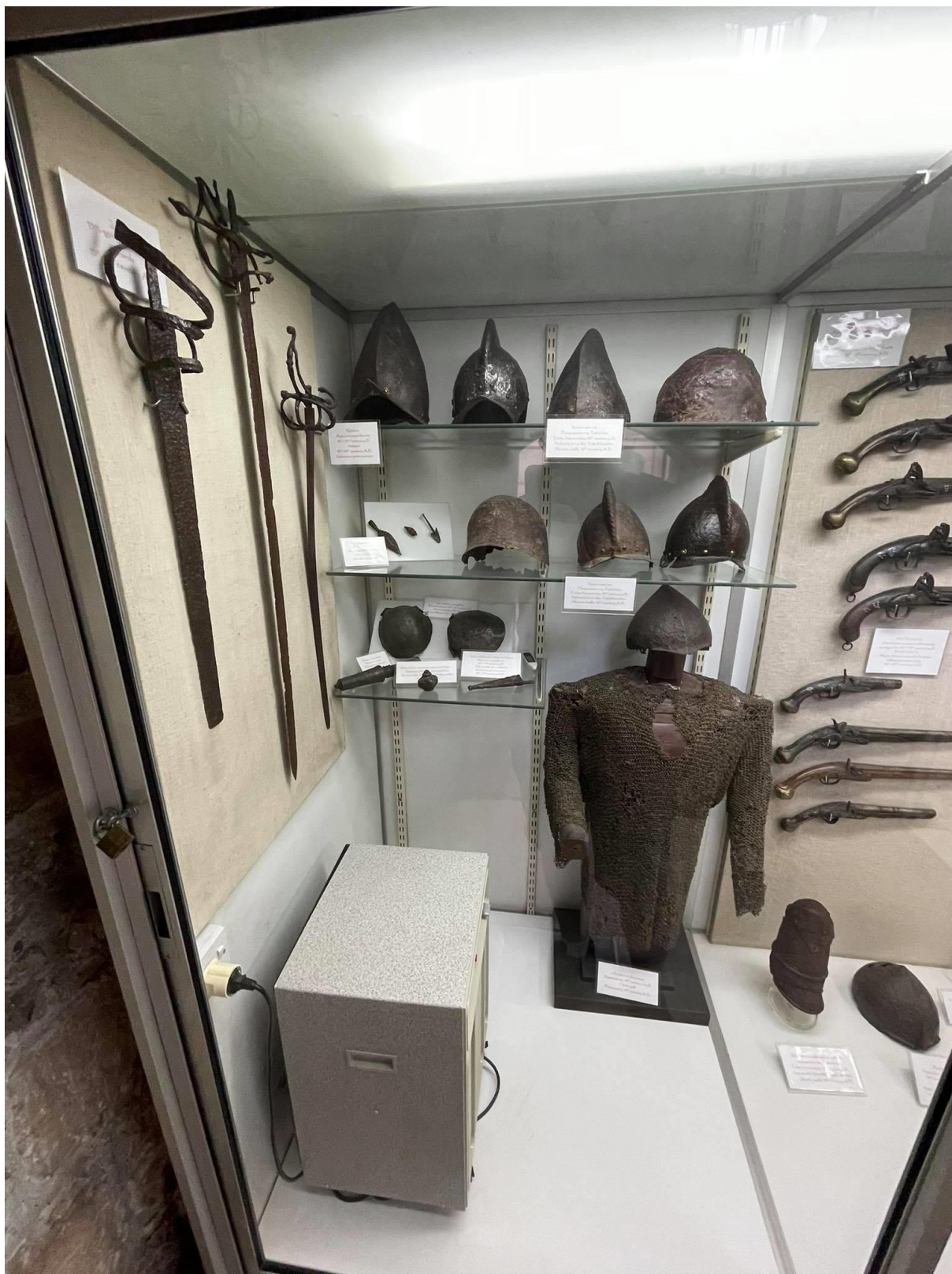
Eksponaty powiązane z historyczną militaryką Cypru. Artefakty i broń znajdują się w Zamku w Limassol, które obecnie pełni funkcję Muzeum Broni Średniowiecznej.